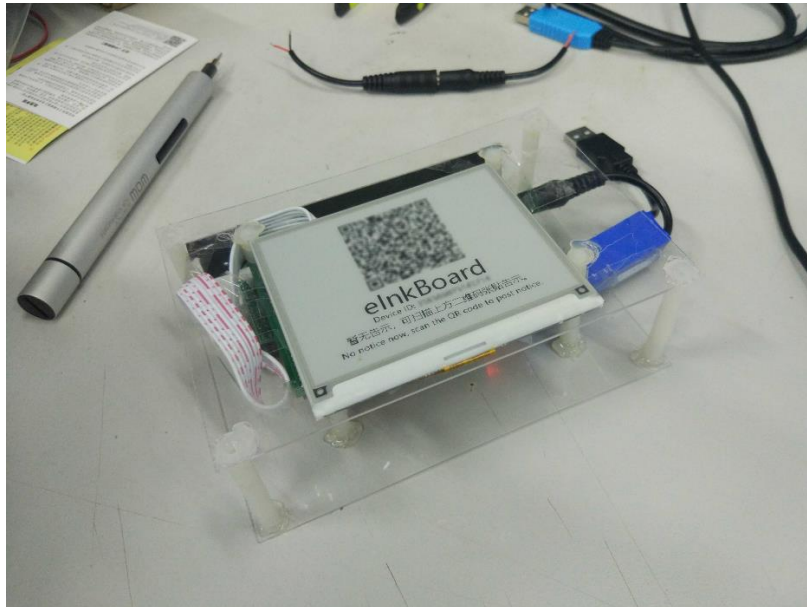
图 2 eInkBoard demo 的实物外观, 此时显示的是初始页面